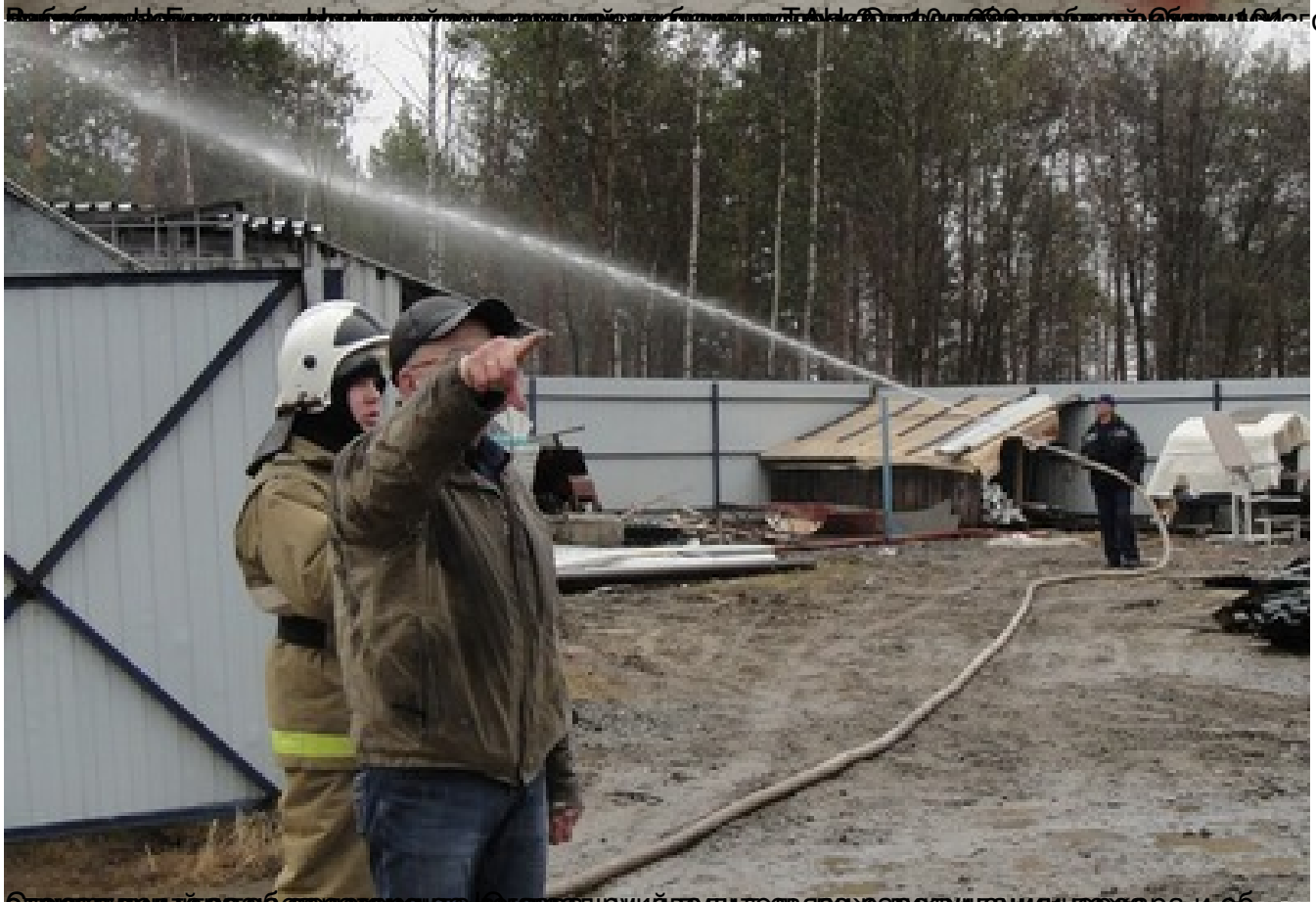
Отурасливують разаб дажалофана цагаца, руйй вудитесьязо жаротвидациячфара и об