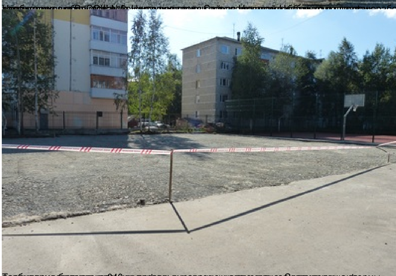
Территория будет выделена 40 квадратных метров, уже установлена архитектурная форма,