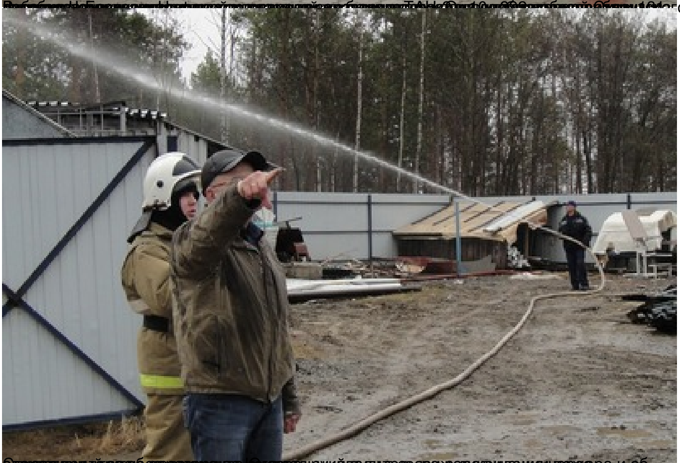
Отурасливують разаб дажалофана цагаца, руйй вудитесьязо жарокуцацациячфара и об