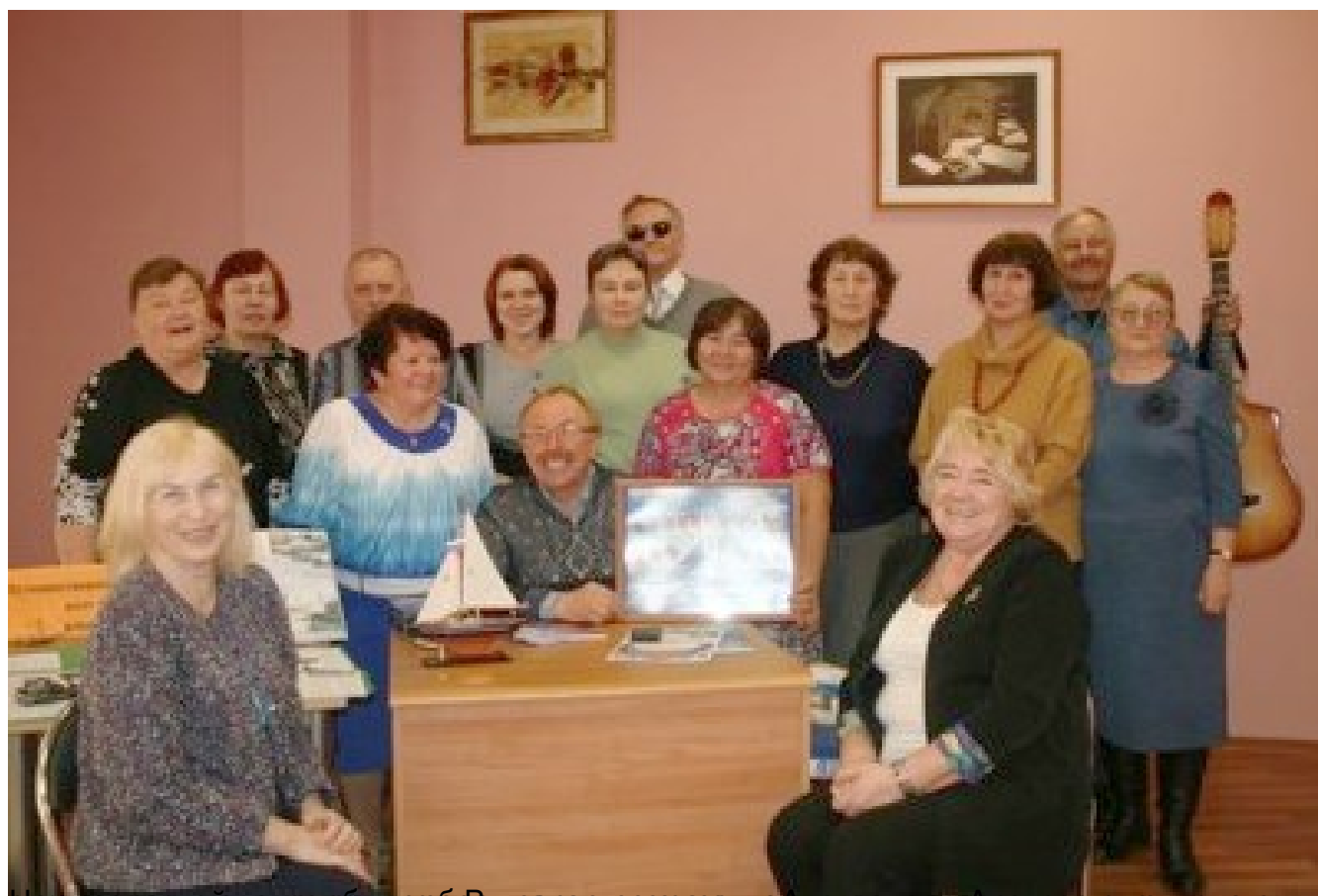
Юбилейный вечер в библиотеке Нефтеюганска. В центре - юбилярша. Рядом с ней - организатор вечера. Справа - ведущий вечера. В центре - вручение диплома. Справа - ведущий вечера. В центре - вручение диплома. Справа - ведущий вечера.