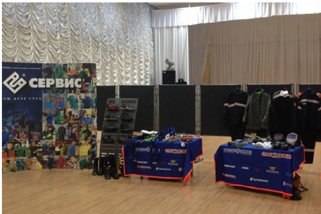
Брандмастеры мероприятия в рамках семинара-выставки по охране труда с презентацией продукции ПИДЭИ в г. Нефтеюганске