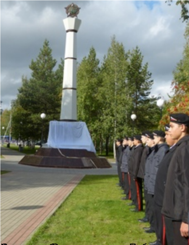
Губернатор Ханты-Мансийского автономного округа Югры Наталья Комарова и глава Нефтеюганского района Владимир Дроздов с представителями администрации и ветеранами в день открытия стелы