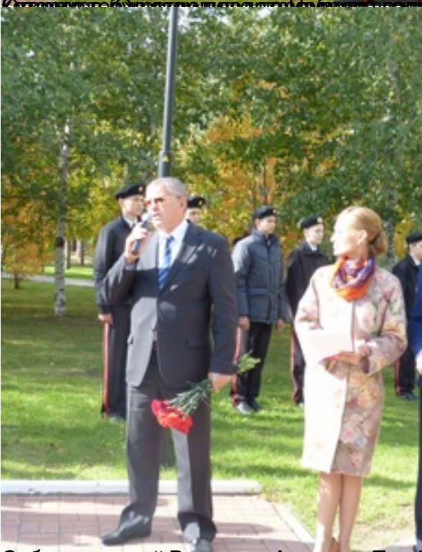
Губернатор Ханты-Мансийского автономного округа Югры Наталья Комарова и глава Нефтеюганского района Владимир Дроздов с представителями администрации и ветеранами в день открытия стелы