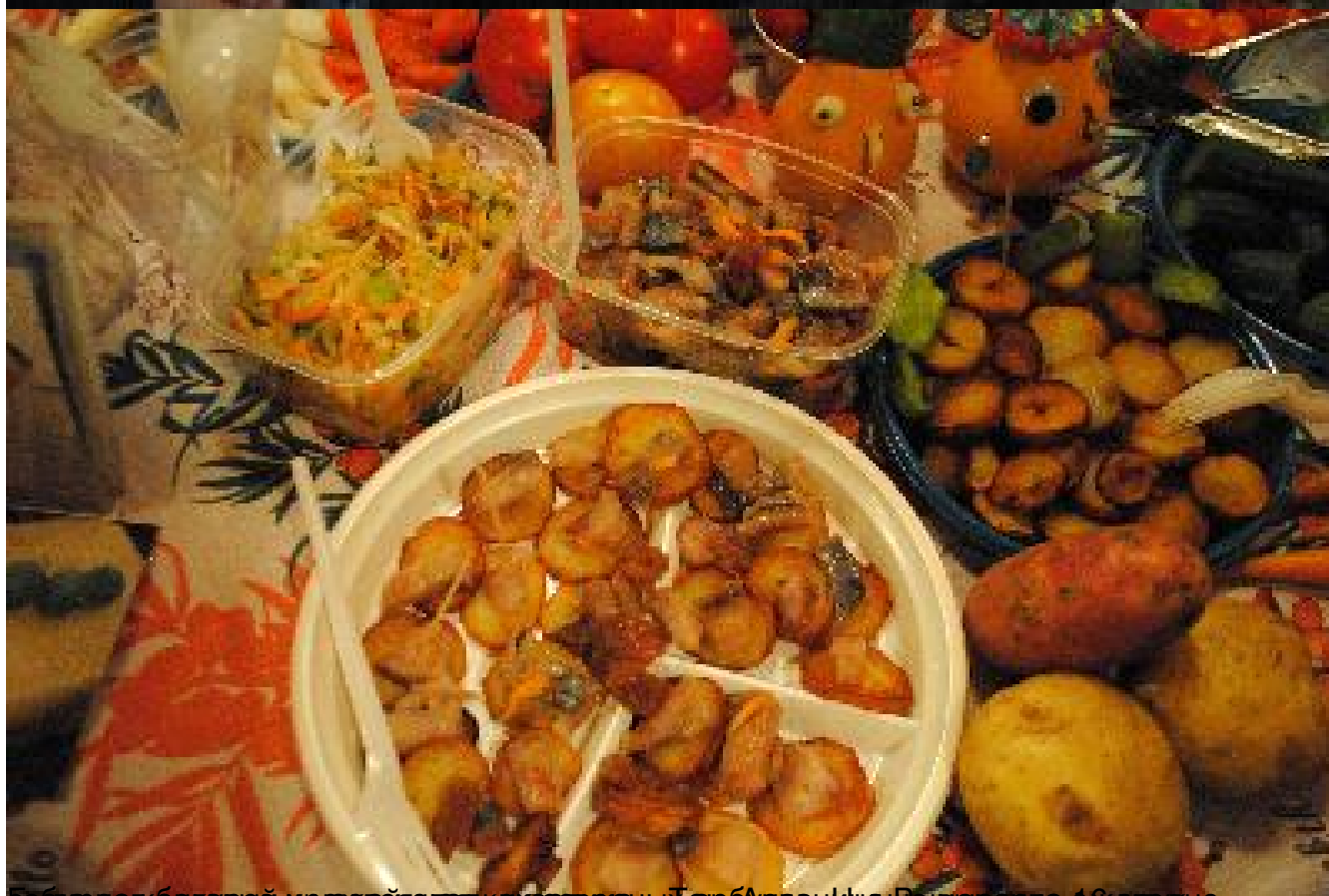
Собраны баклажаны и морковь, как всегда, у арбузовница Рыбаренко 48 спудно