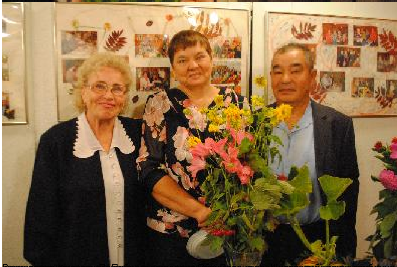
Воспитатель уссурийского детского сада в г. Владивостоке в центре культуры и досуга в г. Хабаровске